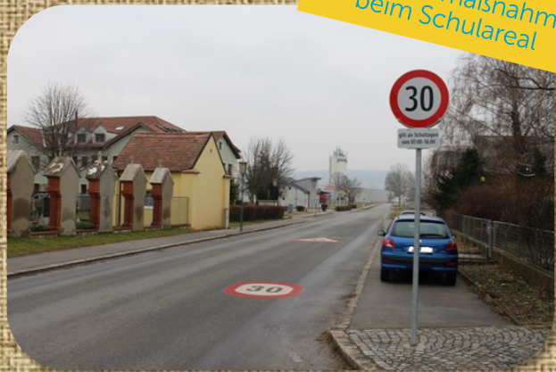
Sicherheitsmaßnahmen beim Schulareal