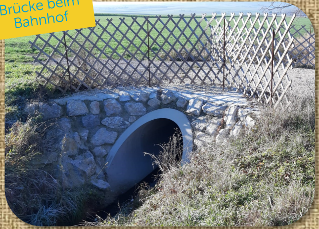
Brücke beim Bahnhof