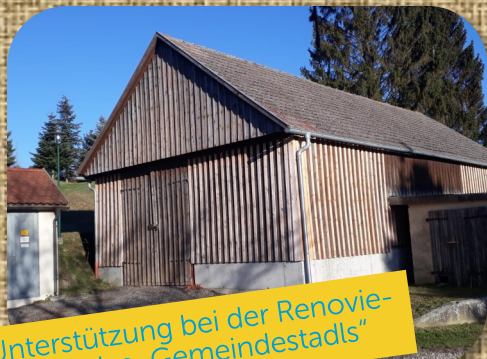
Unterstützung bei der Renovierung des „Gemeindestadls“