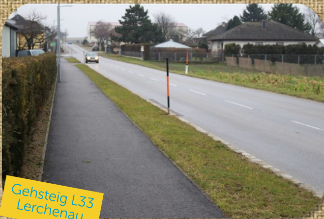
Gehsteig L33 Lerchenau