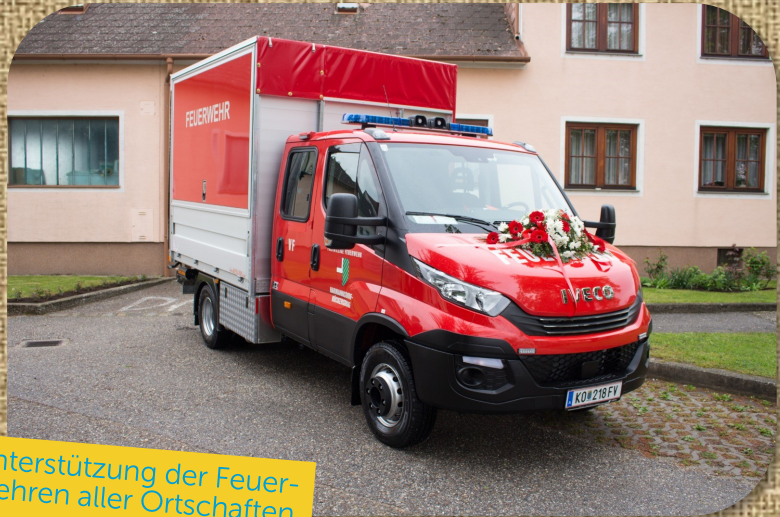
Unterstützung der Feuerwehren aller Ortschaften