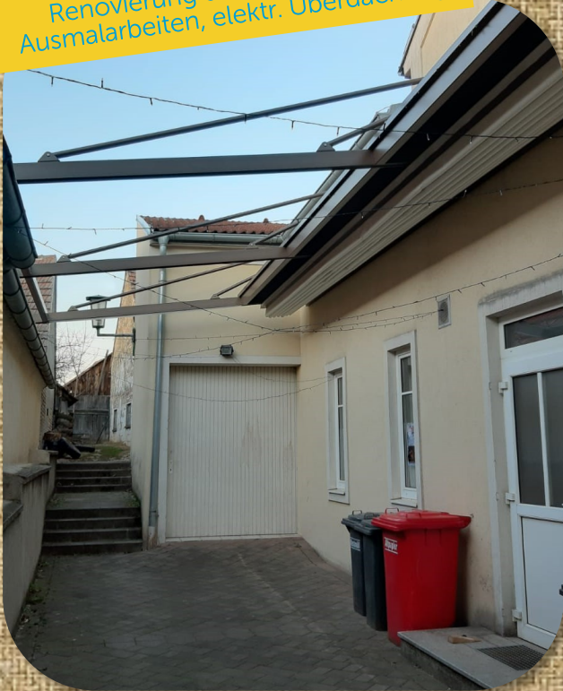
Renovierung des Haindlhauses: Ausmalarbeiten, elektr. Überdachung