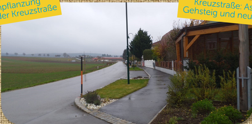
Kreuzstraße: Asphaltierung, Gehsteig und neue Beleuchtung