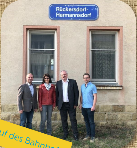
Kauf des Bahnhofs