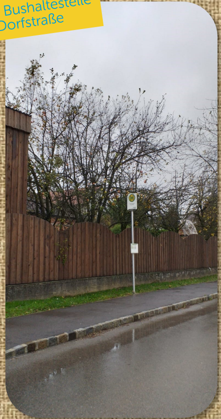
Neue Bushaltestelle Dorfstraße