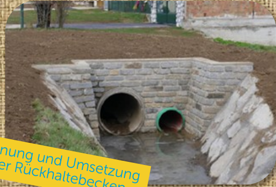
Planung und Umsetzung der Rückhaltebecken