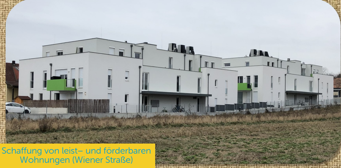
Schaffung von leist- und förderbaren Wohnungen (Wiener Straße)