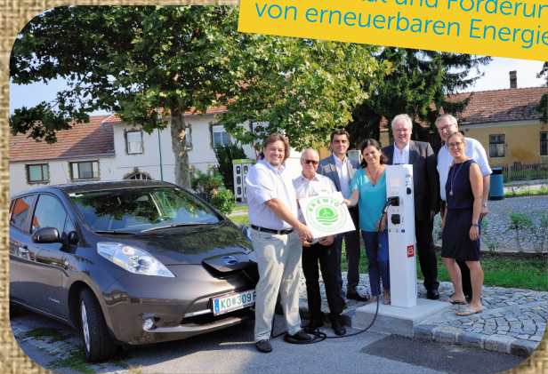
E-Mobilität und Förderung von erneuerbaren Energien