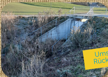
Umsetzung von Rückhaltebecken