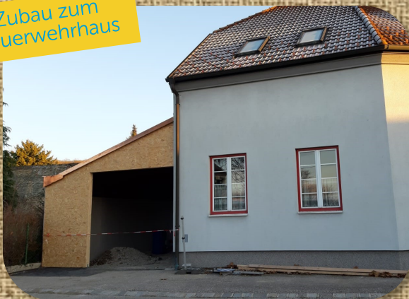
Zubau zum Feuerwehrhaus