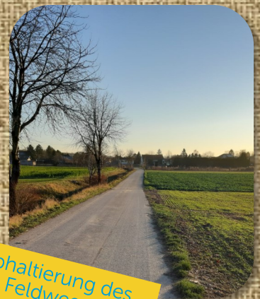
Asphaltierung des Feldwegs