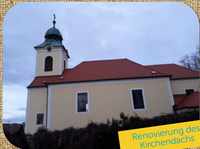
Renovierung des Kirchendachs