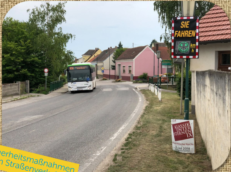
Sicherheitsmaßnahmen im Straßenverkehr