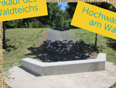
Hochwasserschutz am Waldteich