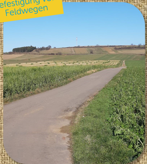
Befestigung von Feldwegen