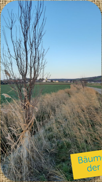
Bäume entlang der Gräben